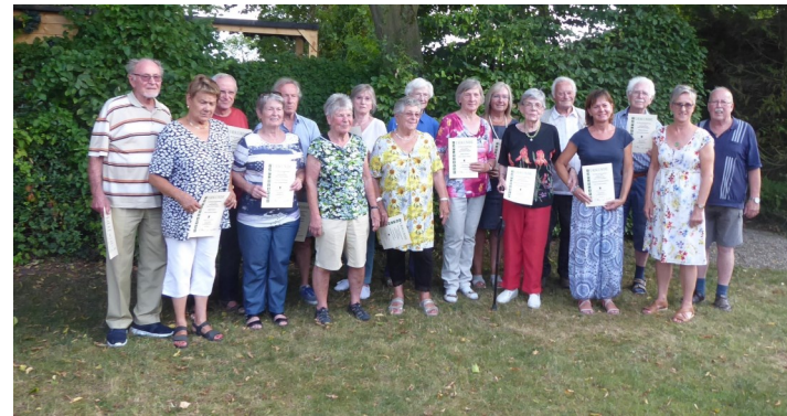
BSG Hemsbach Vereinsheim am Wiesensee ☎ 06201-472419